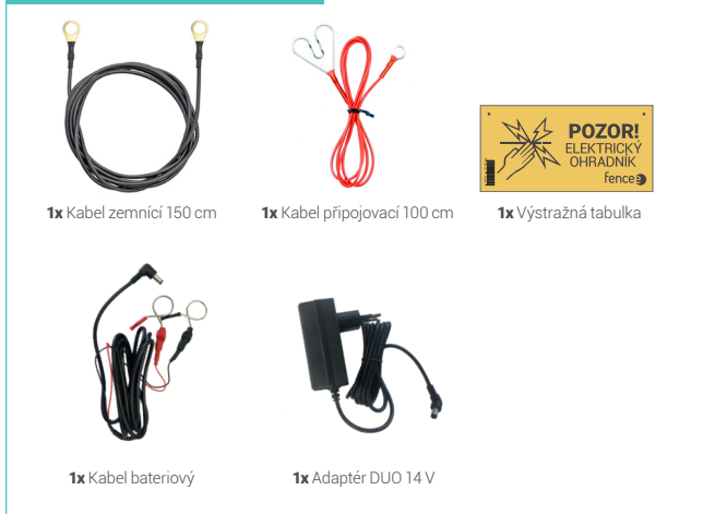
1x Kabel zemní 150 cm