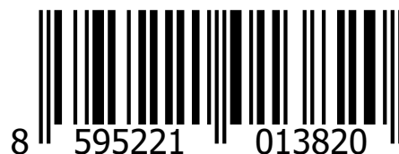
1x Adaptér DUO 14 V